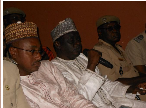
Intervention du Ministre de l'Environnement et du Développement Durable