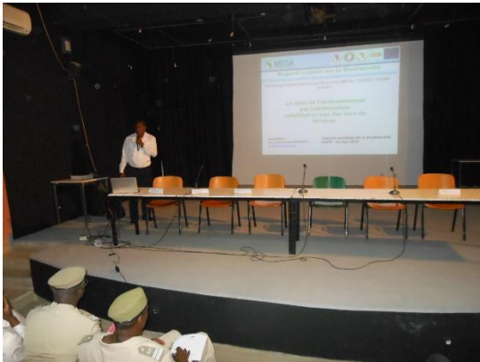
M. Issa du CRA pendant sa présentation