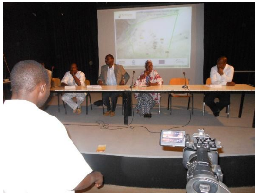
Table des panélistes