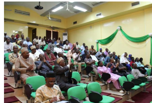
Vue des participants

Toutes ces qualités ont été auréolées par une promotion qui s'est traduite par son recrutement en qualité d'assistant technique de l'Union Européenne dans un projet sur les changements climatiques basé à Ndjamená.