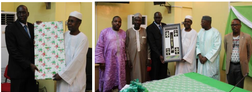
Remise d'un cadeau par le Secrétaire Exécutif

...un cocktail a été servi à la fin de la cérémonie